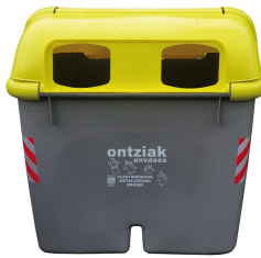
Recipiente de plastic, metal și cutii