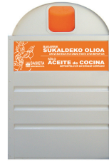
Ulei de gătit folosit