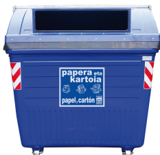
Hârtie și carton